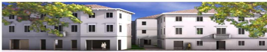
VISTA TRIDIMENSIONALE DA VIA XXX APRILE